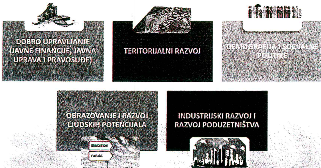
Slika 3. Horizontalne politike